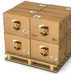
Palet: 28 cajas