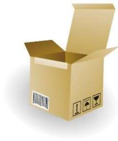
Caja Completa: 196 uds