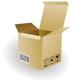
Caja Completa: 1 ud