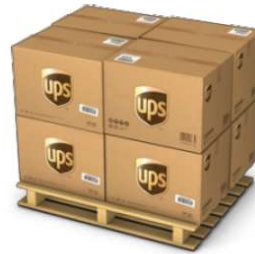
Palet: 100 uds