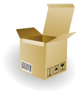
Caja Completa: 1 ud